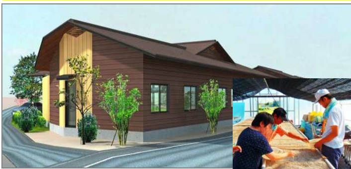
就労支援B型事業所（農園・加工場）