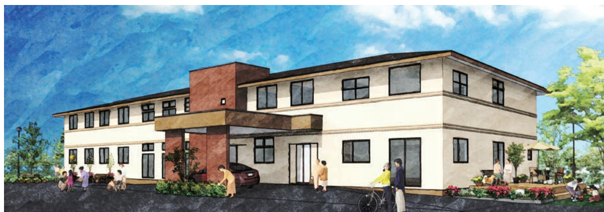
愛媛県内当社施工事例