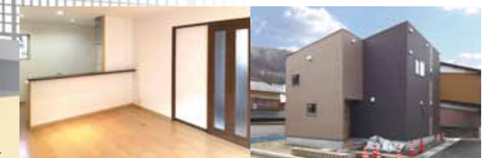
※パースは図面に元に描きおこしたイメージにつき、実際とは異なる場合があります。